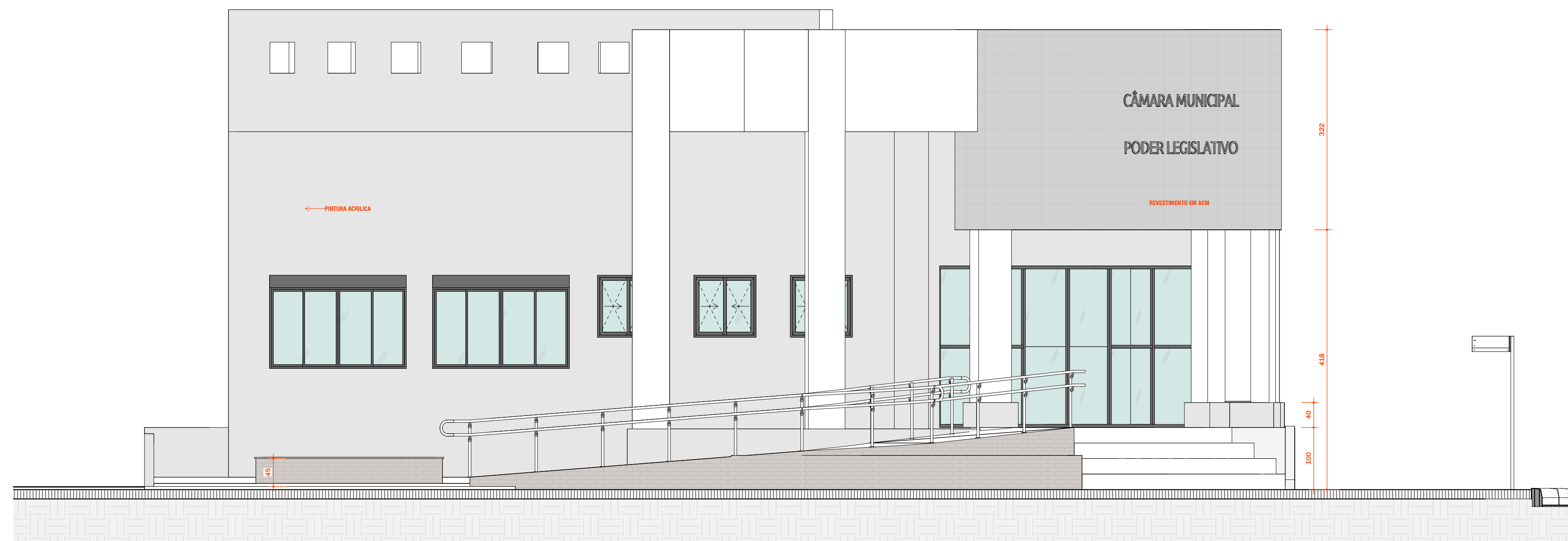
2 - Corte 1 Escala: 1:50